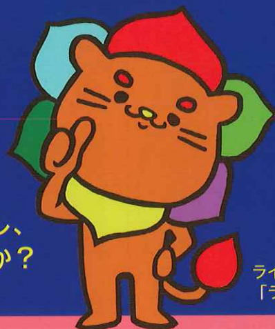
ライズキャラクター 「ライズオン」

「やりっぱなし」の研修ではなく「じわじわ」と変化し、 社員の「考動」につながる人材育成に取り組みませんか？